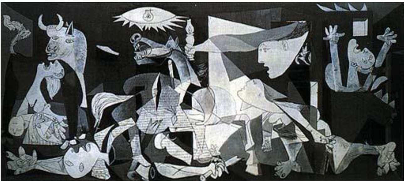
Guernica, P. Picasso

15 dicembre: inizio della battaglia di Teruel ad opera dell'esercito repubblicano in difesa della Catalogna. La città viene conquistata (9 gennaio), ma in seguito alla controffensiva franchista viene nuovamente perduta (22 febbraio)