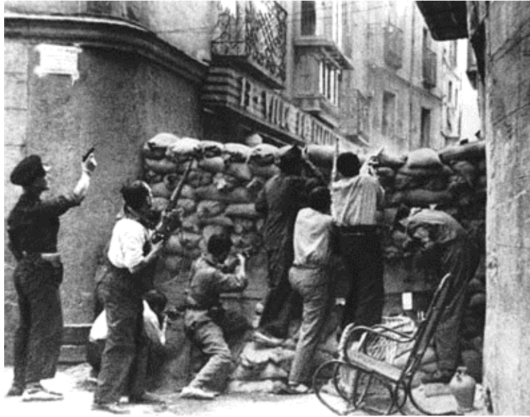
Barcellona, maggio 1937: la difesa della centrale telefonica